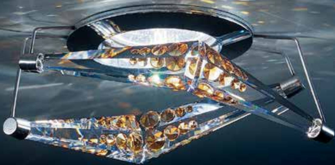
A.8992 NR 500 110