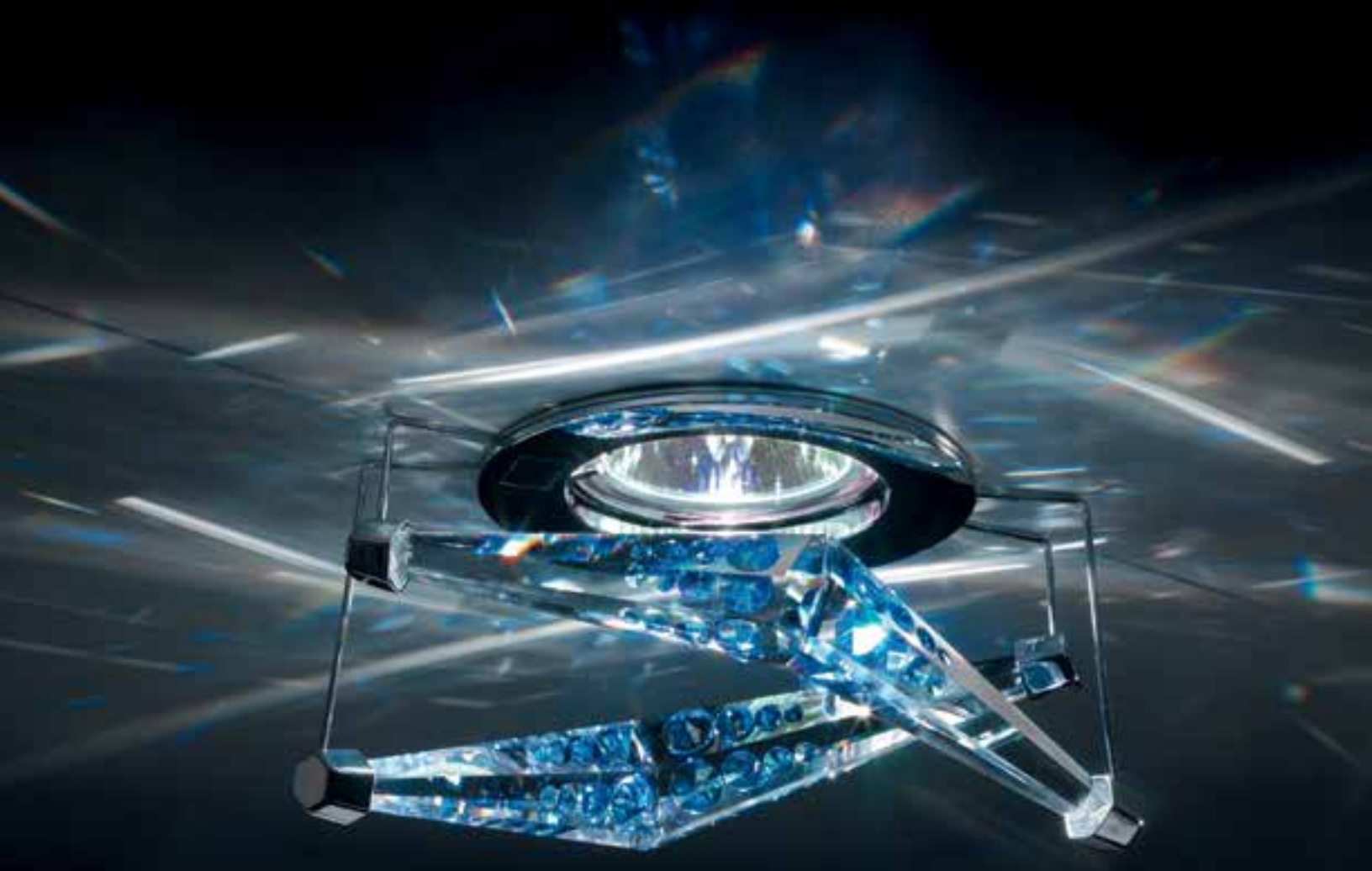
A.8992 NR 500 011