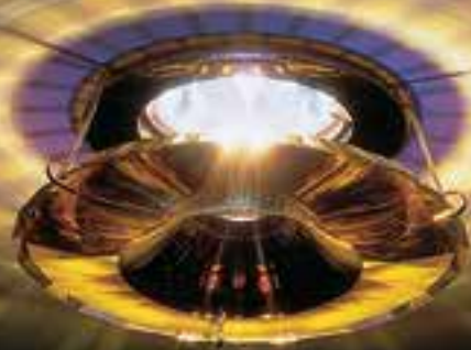
A.8992 NR 030 009 MOON