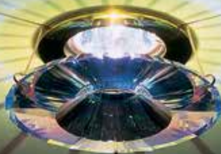
A.8992 NR 030 009 AB