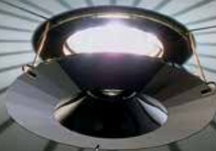
A.8992 NR 030 009 JET